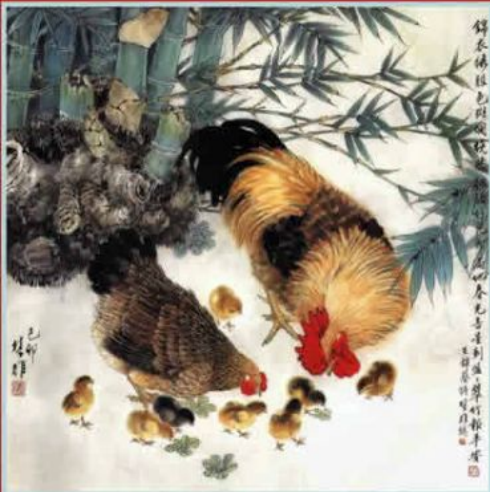
十二生肖 鸡 89 x 68.5cm 1999年