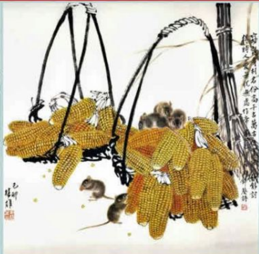
十二生肖 鼠 89.7 x 68.6cm 1999年