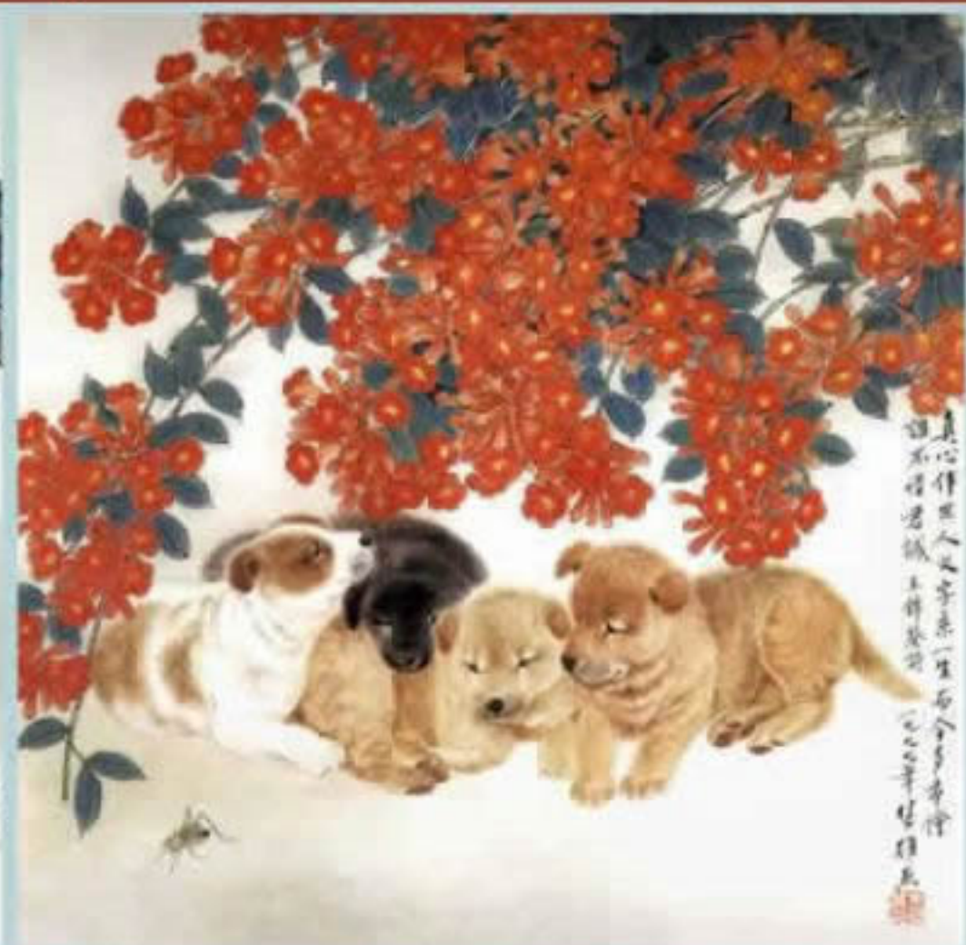
十二生肖 狗 69 x 68,5cm 1999年