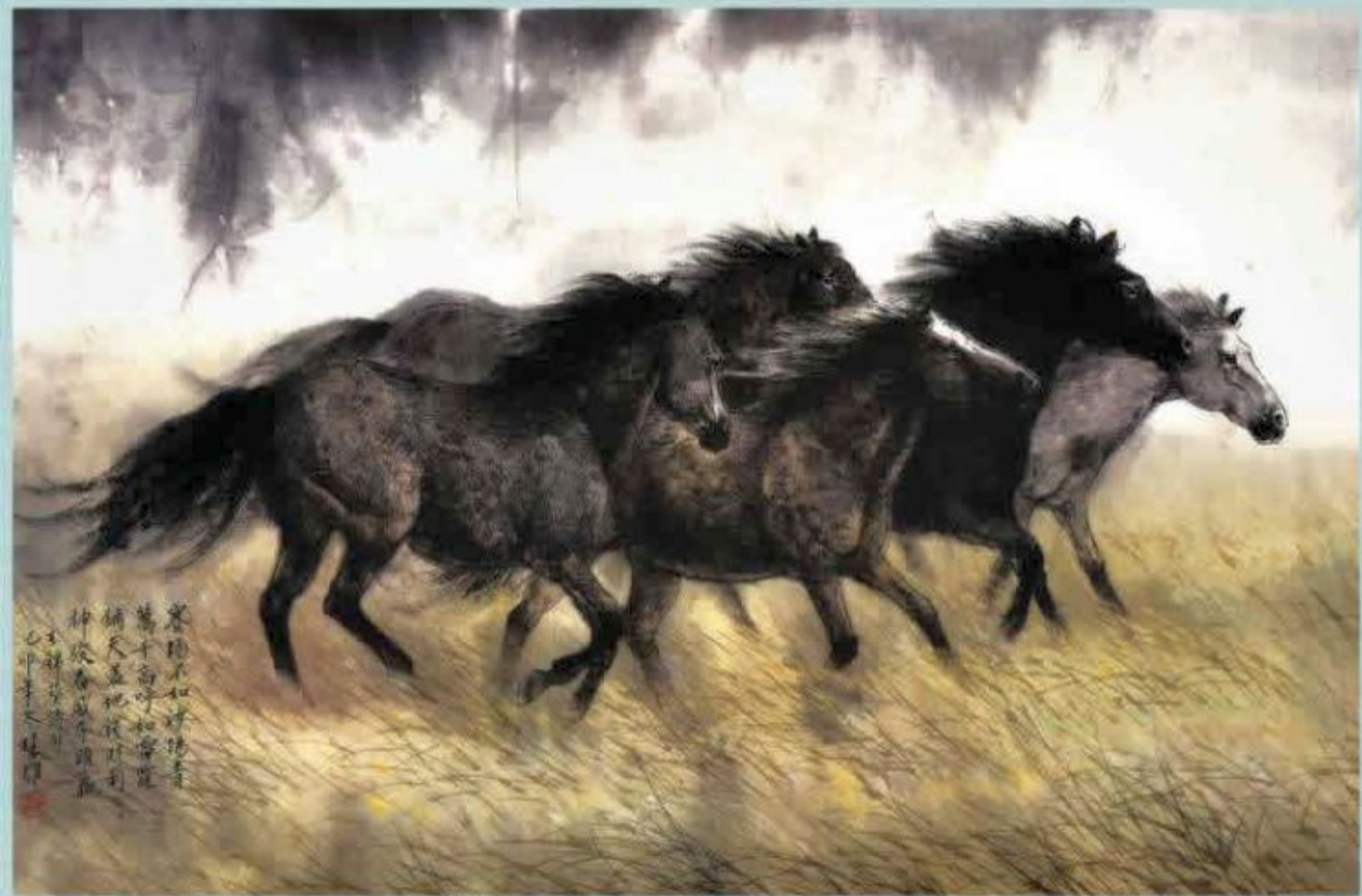
奇威夺头赢 55x86.8cm 1999年