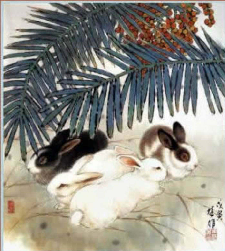
小尾 35,8 x 49,5cm 1998年