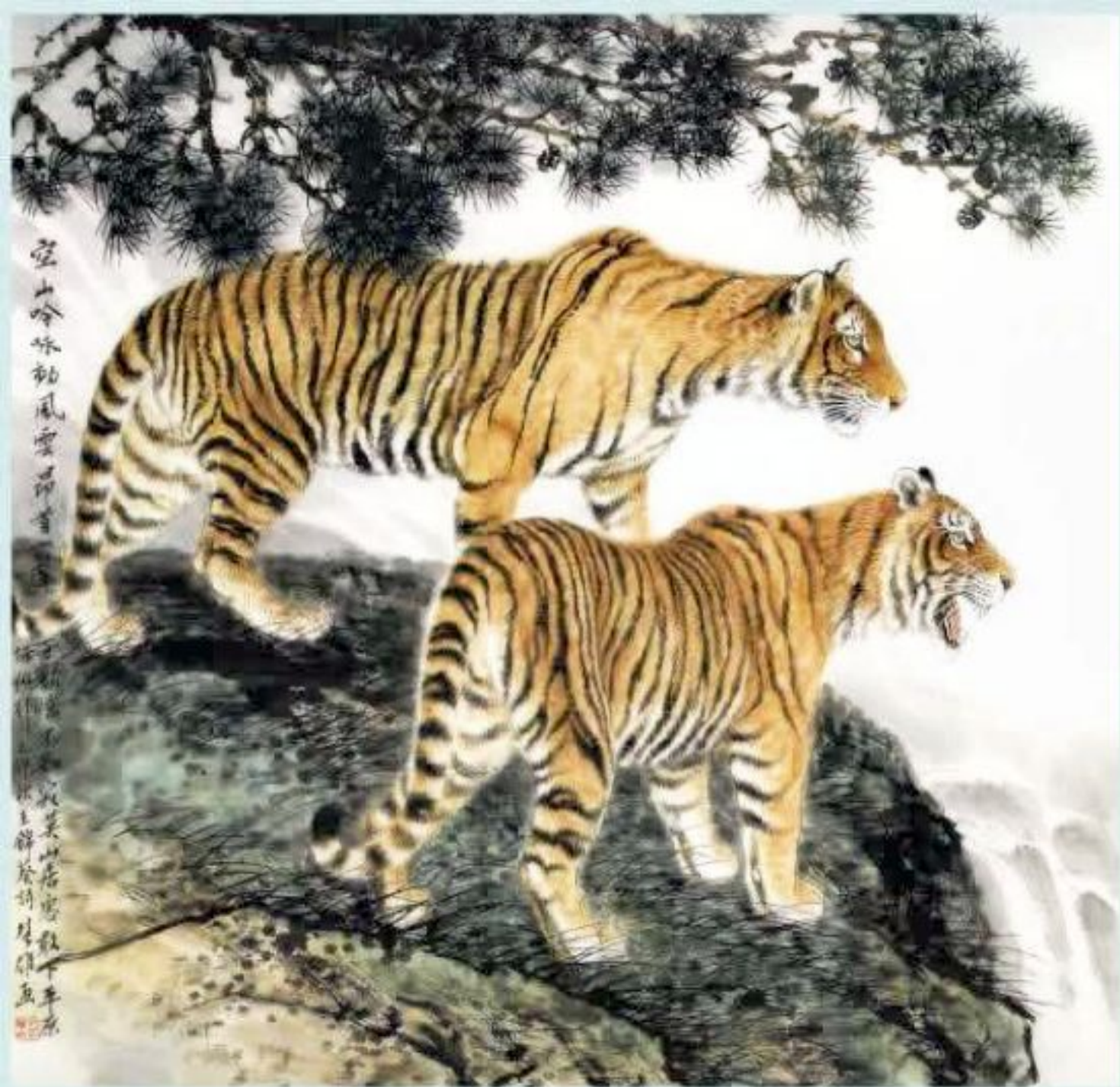
十二生肖 虎 69.7 x 68.6cm 1999年