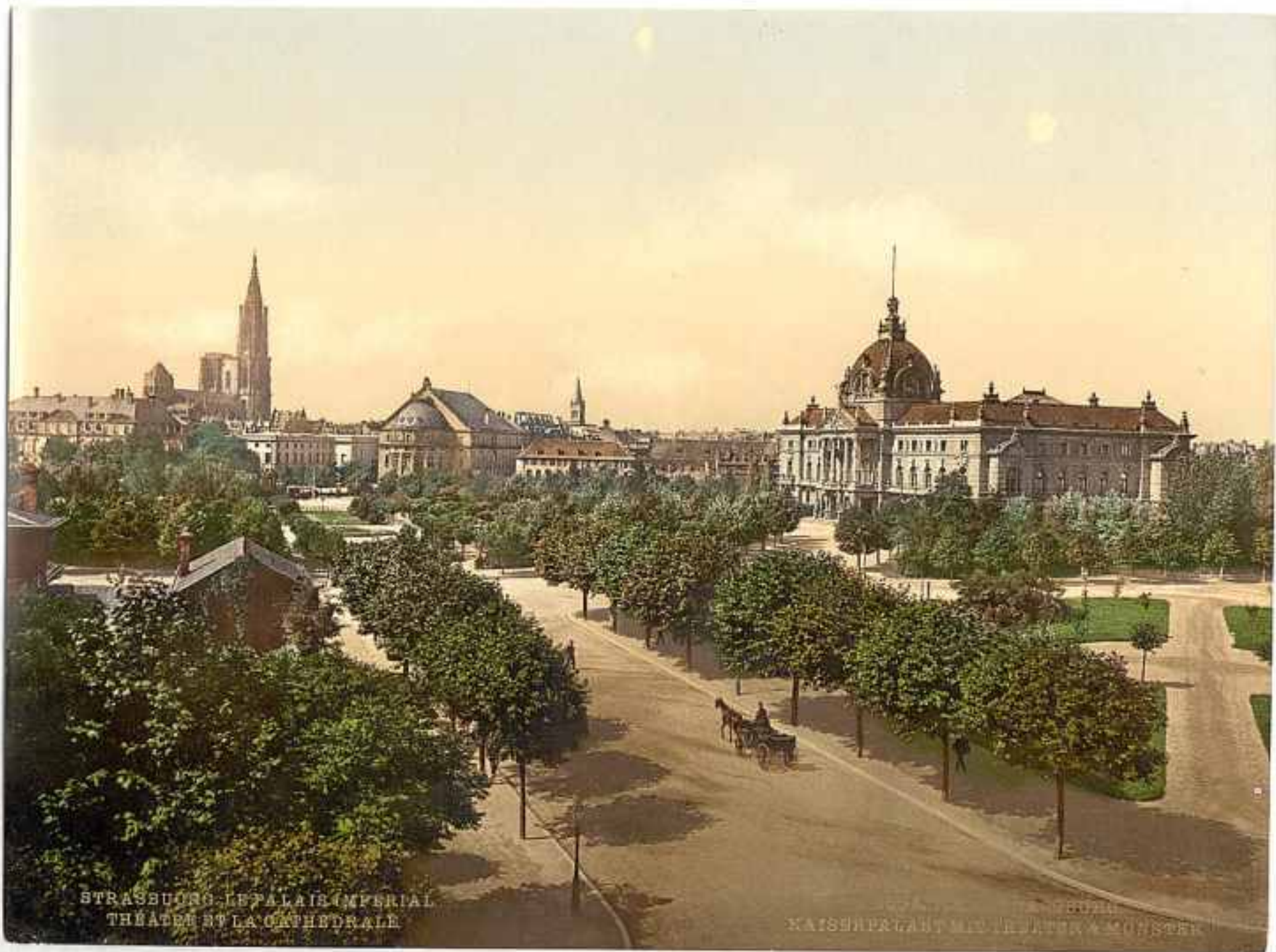
STRASBUROG. LE PALAIS IMPERIAL THEATRE ET LA CATHEDRALE