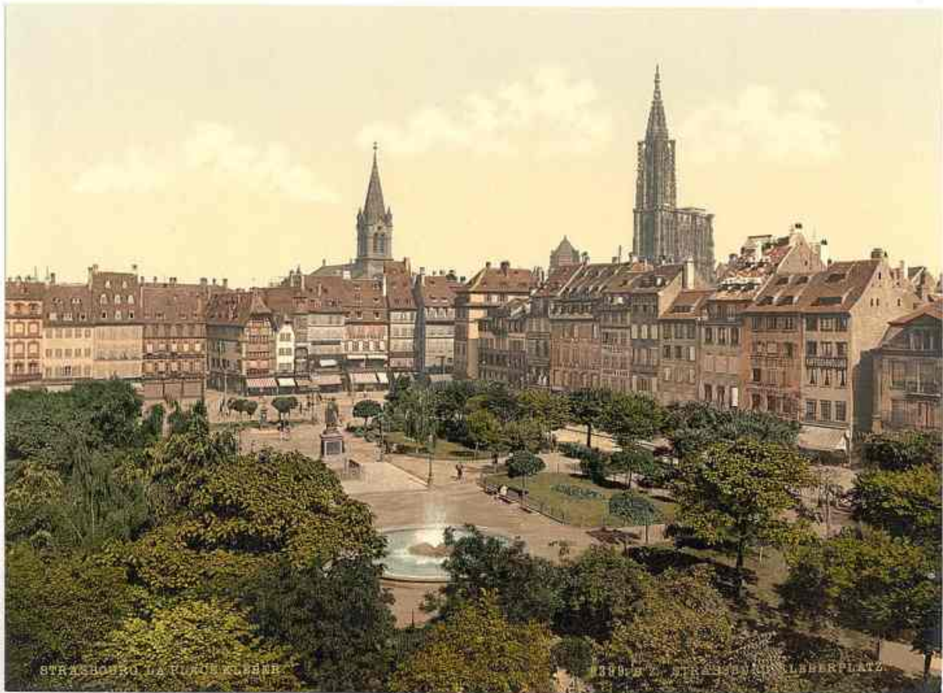
STRASBOURG LA FONTAINE KOENIG