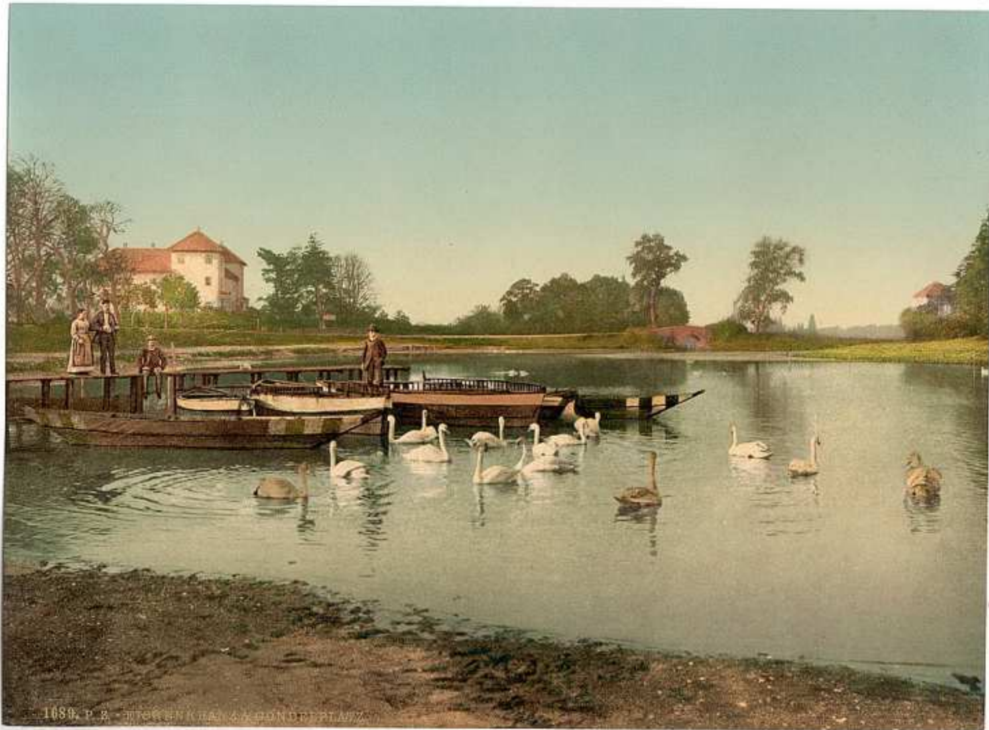
1089. P. B. - TOWER HILL & POND PLAZA