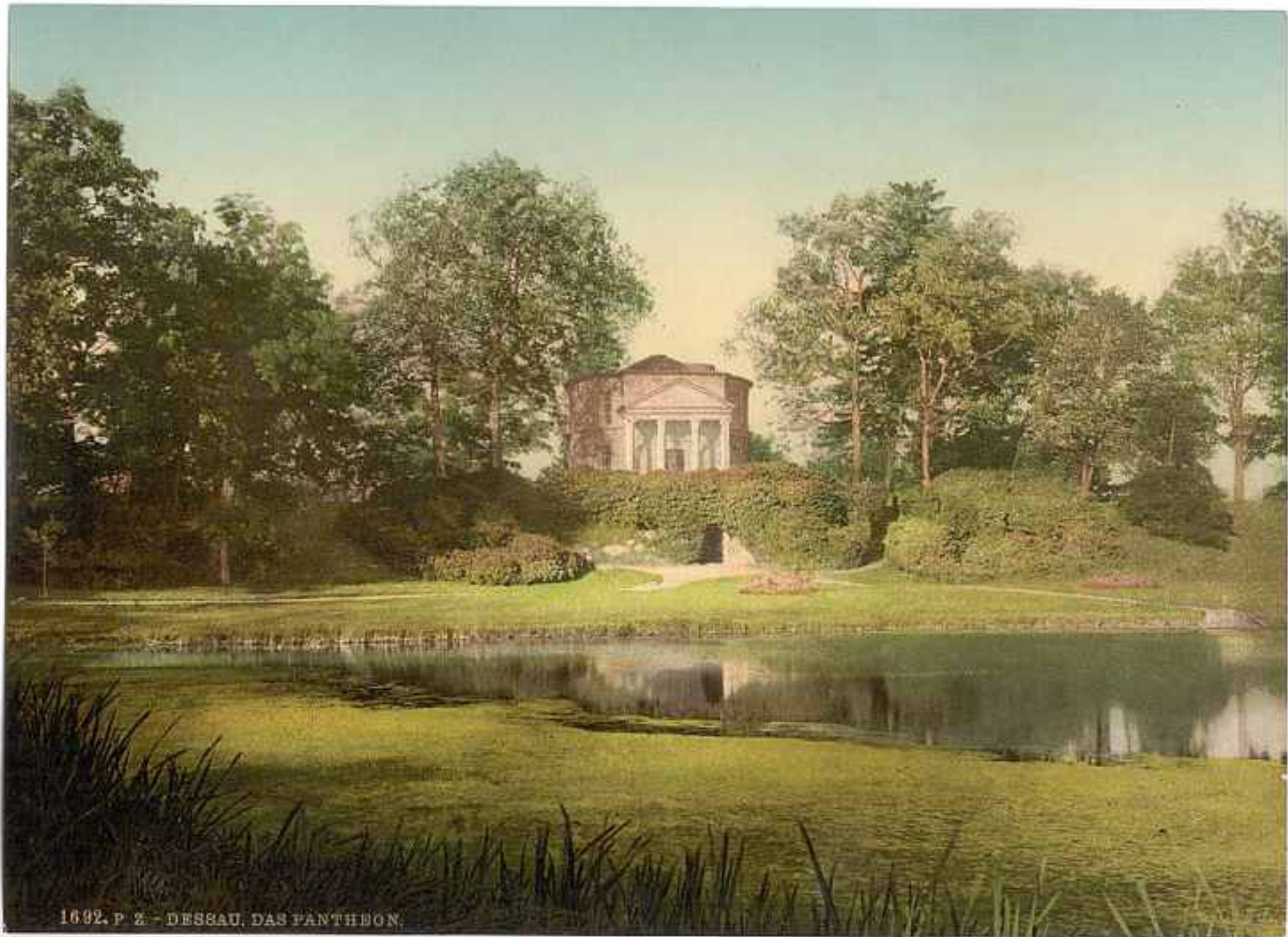
1692. P. 2 - DESSAU, DAS PANTHEON.