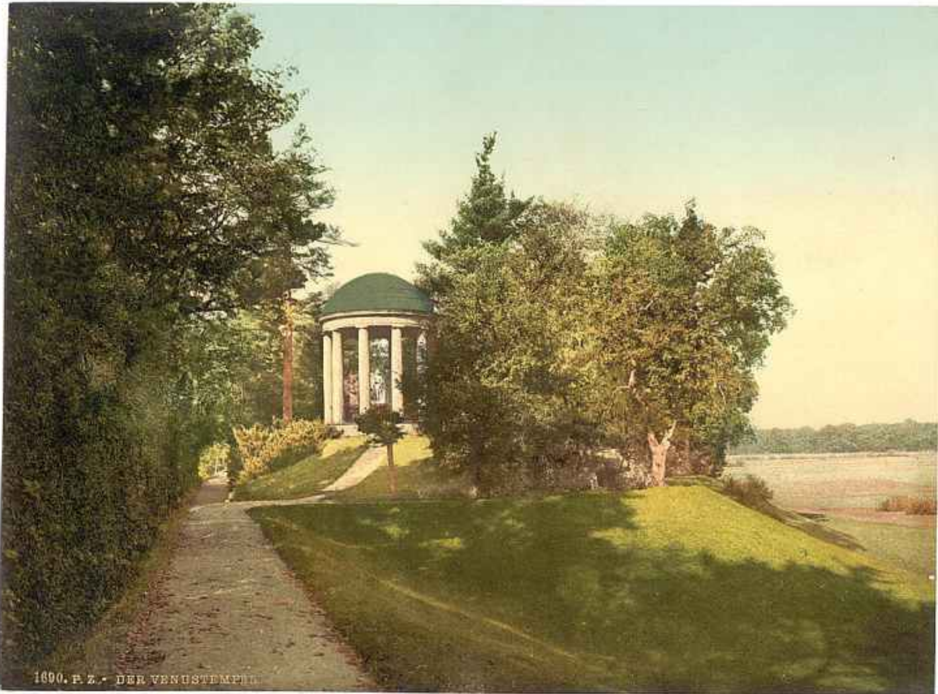
1890. P. Z. - DER VENUSTEMPEL