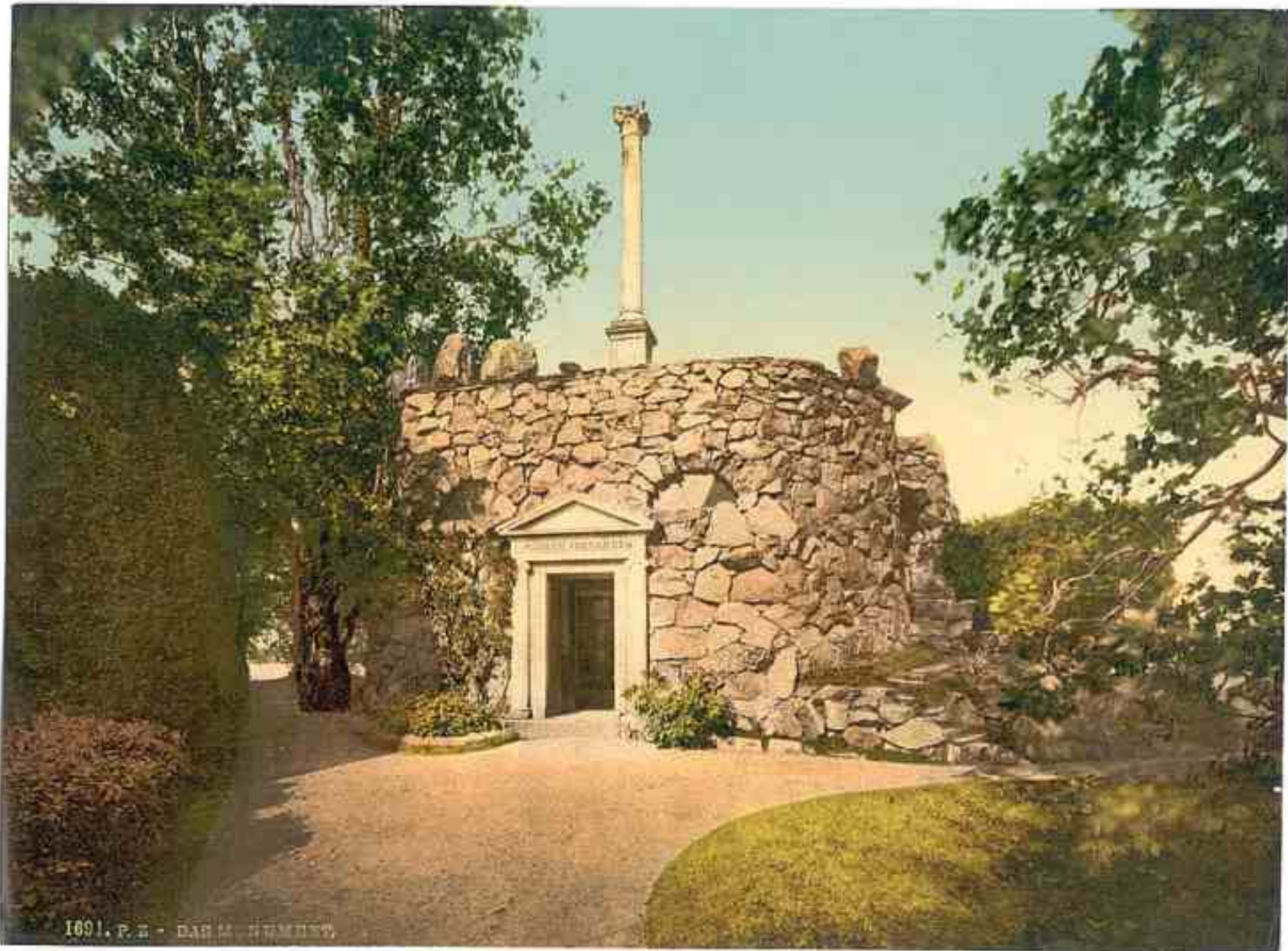
1891. P. E. - DAR M. HUMMETT.