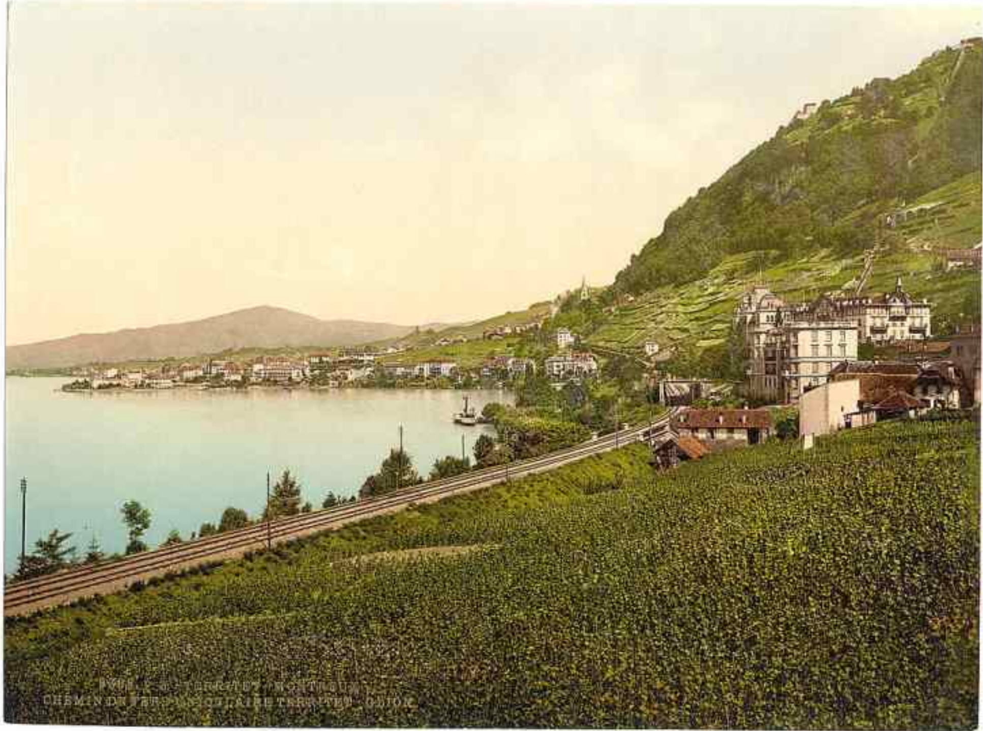
1908. CHEMIN DE FER VAUDAIS. MONTREUX. SUISSE.